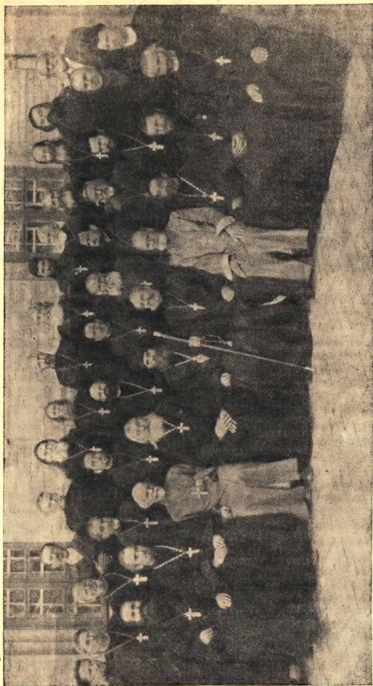
ЕПАРХИАЛЬНЫЕ КУРСЫ В ИЗМАЙЛЬСКОЙ ЕПАРХИИ